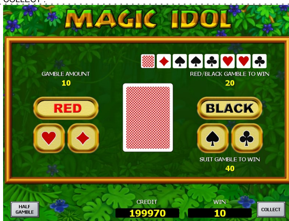
Игра на риск

ИГРУ НА РИСК можно закончить при желании в любой момент, нажав на клавишу COLLECT.