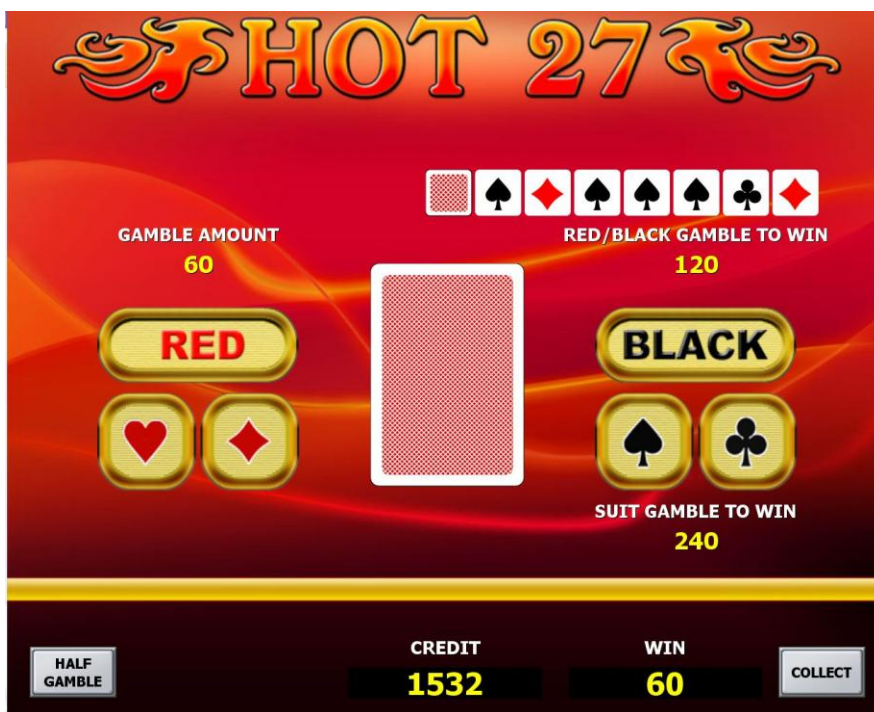
Игра на риск

ИГРУ НА РИСК можно закончить при желании в любой момент, нажав на клавишу COLLECT