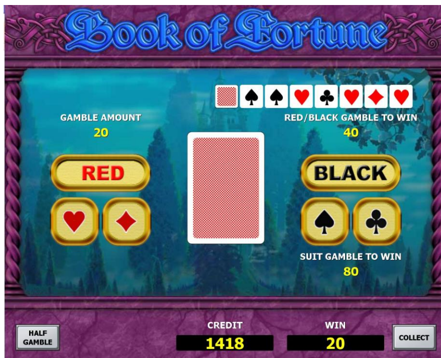
Игра на риск

ИГРУ НА РИСК можно закончить при желании в любой момент, нажав на клавишу COLLECT