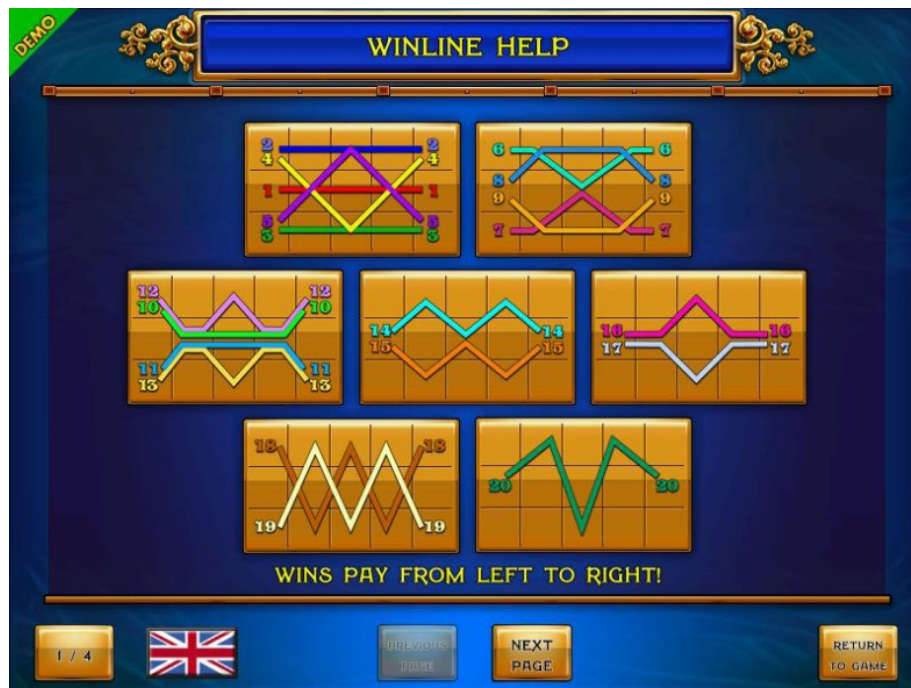
Abimenüü – lehekülg 1