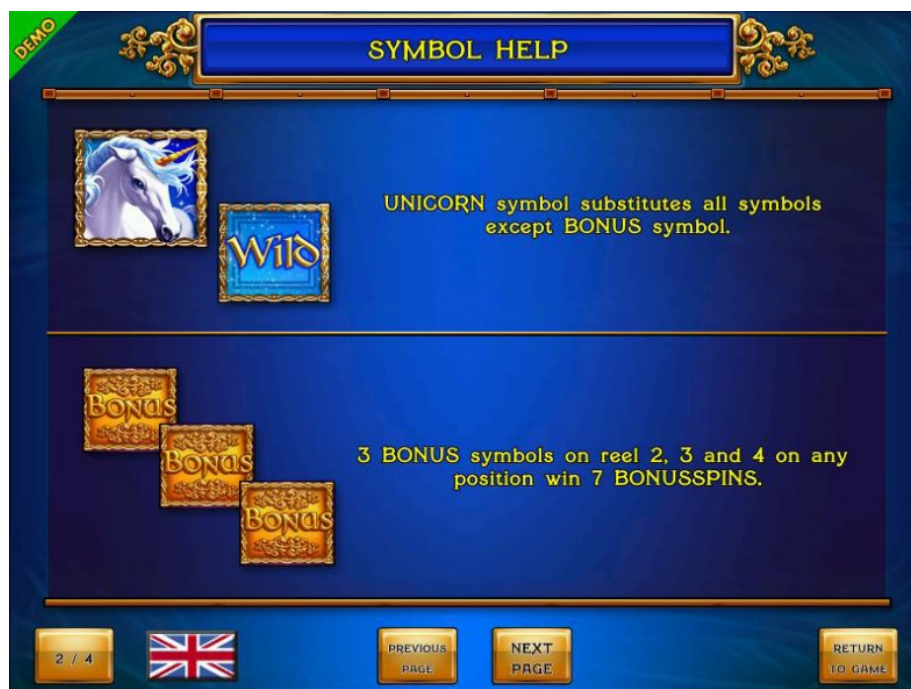
Abimenüü – lehekülg 2

ÜKSSARVE sümbol asendab kõiki sümboleid peale BONUS sümboli.